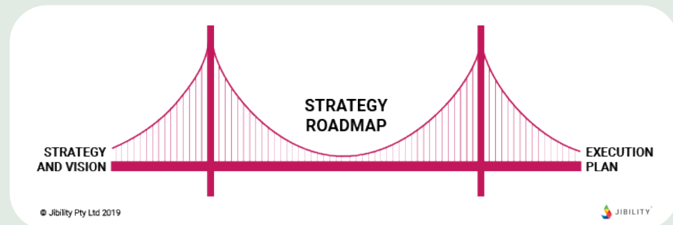
Illustration af et strategisk roadmap, som bygger bro mellem hhv. strategi og vision - og eksekvering.

På Dansk Cykelturismes Generalforsamling i 2023 blev det besluttet at igangsætte en strategiproces, der skal sætte retning for foreningens indsats de kommende år.